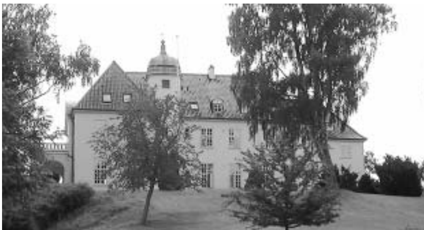
Sølyst fungerer i dag som behandlingshjem.