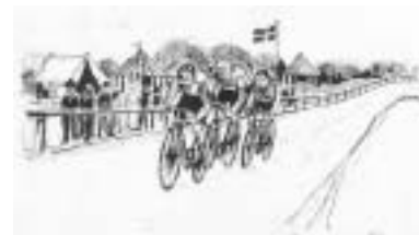
Cykelbanen ved Sølyst var et populært og muntert sted - med 8 totalisatorer - ved århundredskiftet.

Følg vejen fra parkeringspladsen (1) langs Sundet mod broen. På venstre side af vejen ser man nogle høje skrænter med bebyggelse. Det var umiddelbart bag disse skrænter Horsens engang havde en cykelbane. Resterne heraf findes stadig i haven bag Sølyst - der er dog ikke offentlig adgang. Det var den 2. august 1896 provinsens første cementcykelbane: Dansk Cykle- Rings Væddeløbsbane blev indviet. Det blev noget af et tilløbsstykke. Der kom ca. 4000 tilskuere til den 4 timer lange fore-