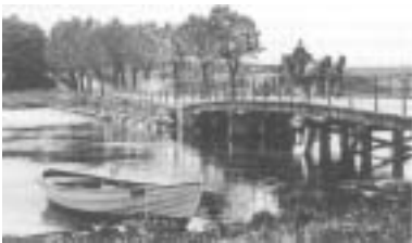
Den første vejbro over Stensballe Sund.

Turen fortsætter over Sundbroen. På højre hånd ligger teglværkets tidligere direktørbolig fra 1910 Hessellund nr. 1 med sit gavltreief, der viser en murstrøge sten.