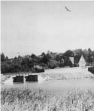
Slusen under broen med den tidligere teglværksbolig til højre.

Turen fortsætter over Sundbroen. På højre hånd ligger teglværkets tidligere direktørbolig fra 1910 Hessellund nr. 1 med sit gavltreief, der viser en murstrøge sten.