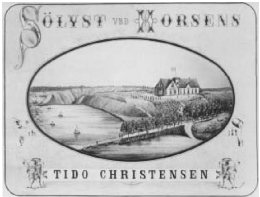
Sølyst som stedet oprindeligt så ud. Bygningen blev opført som traktørsted i 1877.