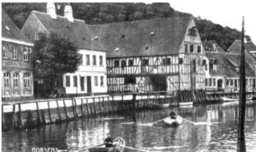
Den gamle åhavn før 1902 med pakbuset.

I modsætning til den gamle åhavns harmoniske proportioner, hvor pakhus og boliger arkitektonisk var beslægtede, virker den nuværende havnebebyggelse noget rodet i sin udformning. Med "kajgaden" mellem vandet og bygningerne opleves havneområdet dog positivt rumdannende.