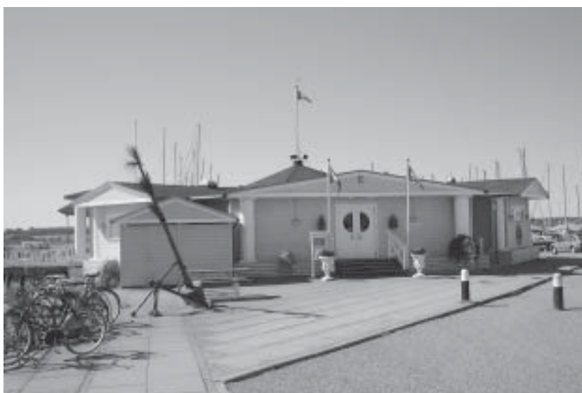
Sejlkлубbens restaurant ved lystbådehavnen .