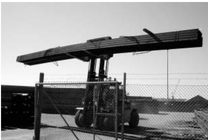
Kørsel med stål på nordhavnen.

Turen tilbage til Industrimuseet går forbi Lystbådehavnen, Roklubben og Kajakklubben langs havnen til lyskrydset Gasvej / Niels Gyldingsgade, og derfra til Industrimuseet (0). Hvis man da ikke ønsker en længere tur: Turen langs sydkajen.